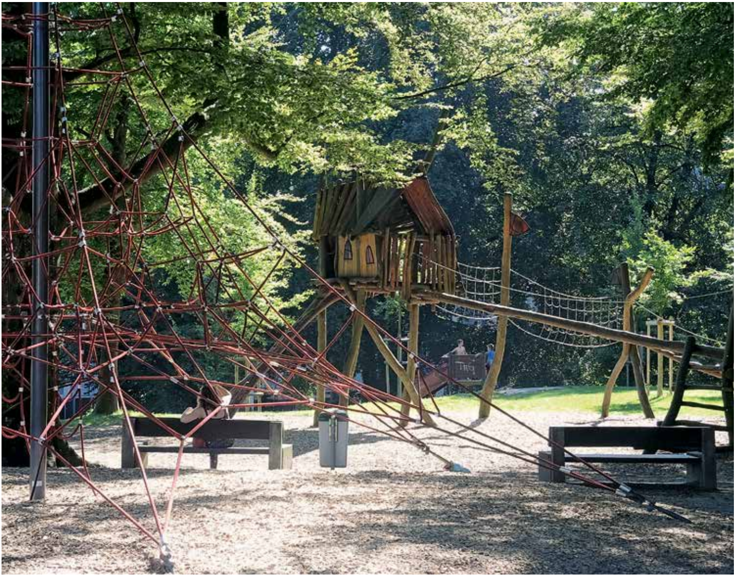
Thom Roelly 2016

Spielplatz Buechwaldpark, St. Gallen. Der Spielplatz, 1955 erbaut, wird laufend an aktuelle Bedürfnisse angepasst. Erweiterungen: Gartenbauamt St. Gallen.