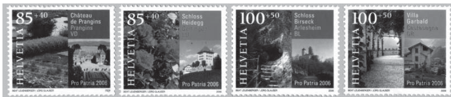
Pro Patria 2006, de gauche à droite : Château de Prangins, Schloss Heidegg, Schloss Birseck, Villa Garbald