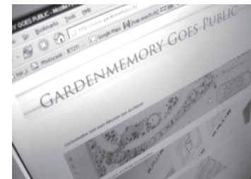
Site internet du projet de recherche: «Garden Memory Goes Public»

Depuis peu, vous trouvez des informations complémentaires concernant ce projet sur notre site internet : www.gardenmemory.ch