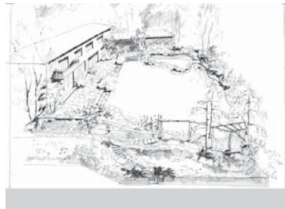
Set de cartes pour correspondance: Jardin d'habitation par Walter Leder, 1944 K. Bischofberger, Zurich

Les membres de la Société de soutien ont reçu un set de cartes à Noël, pour les remercier.